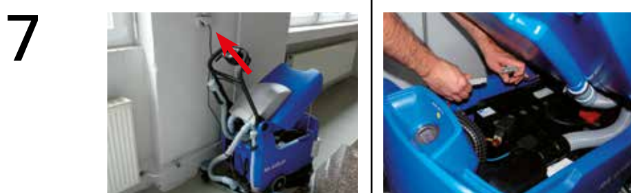
RA 43|B 20 i. L.